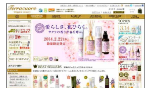
テラコオーレ公式オンラインショップ