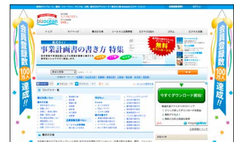
bizocean Web サイトイメージ